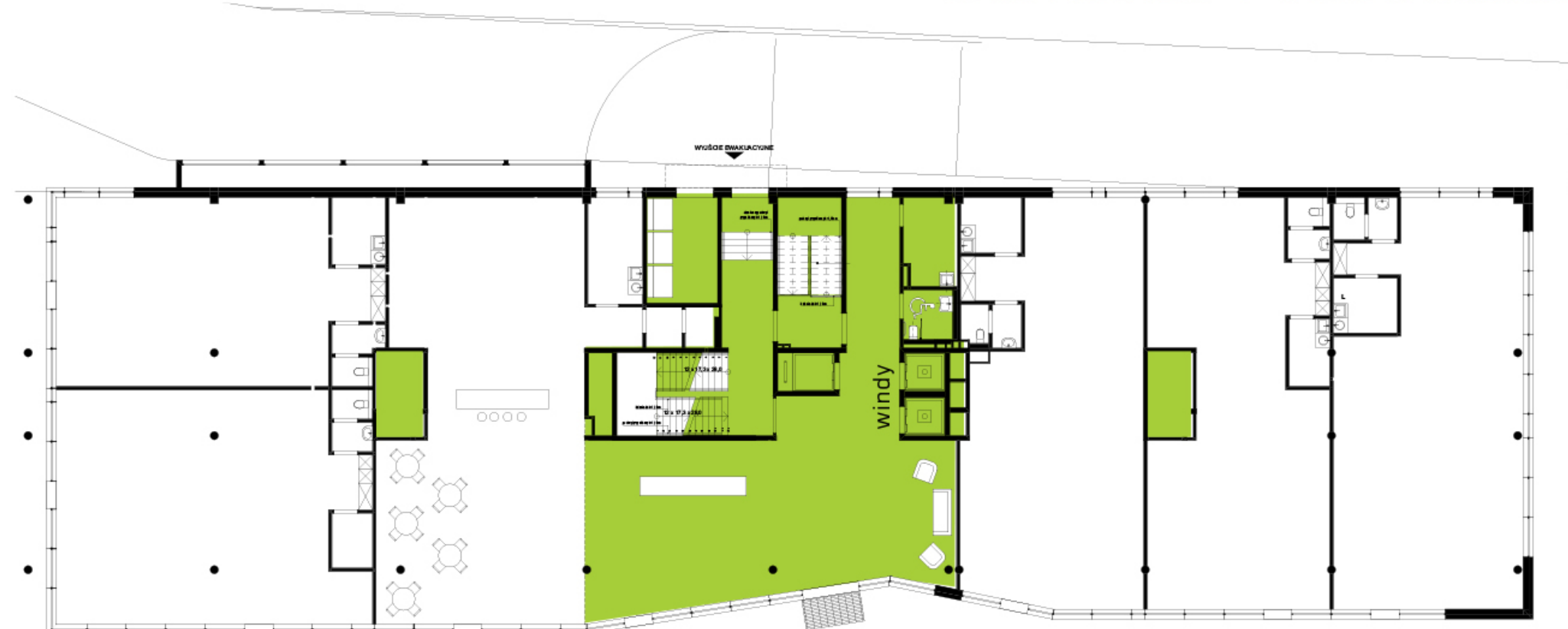
RZUT PARTERU + STREFA WEJŚCIA