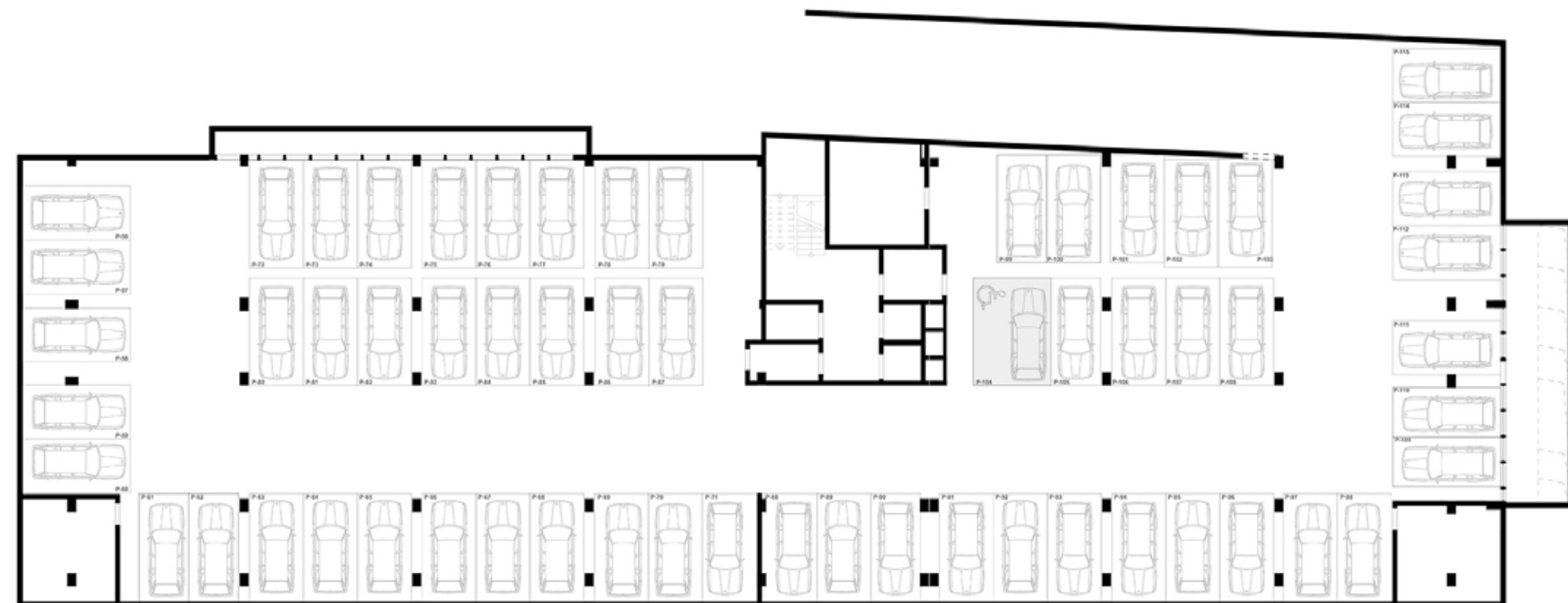
PARKING -2 miejsca postojowe: 60