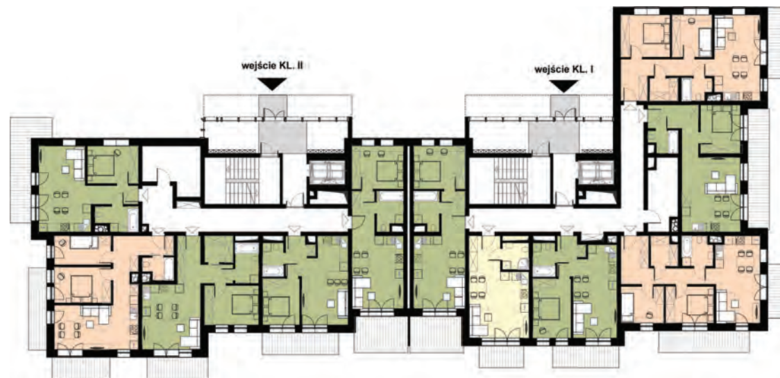
BUILDING TYPE C NUMBER OF FLOORS: 20 NUMBER OF APARTMENTS: 229 RESIDENTIAL USABLE AREA: 9 969 sq m