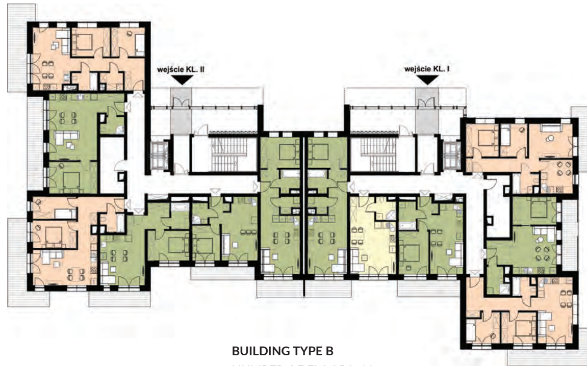
BUILDING TYPE B NUMBER OF FLOORS: 11 NUMBER OF APARTMENTS: 134 RESIDENTIAL USABLE AREA: 5 815 sq m